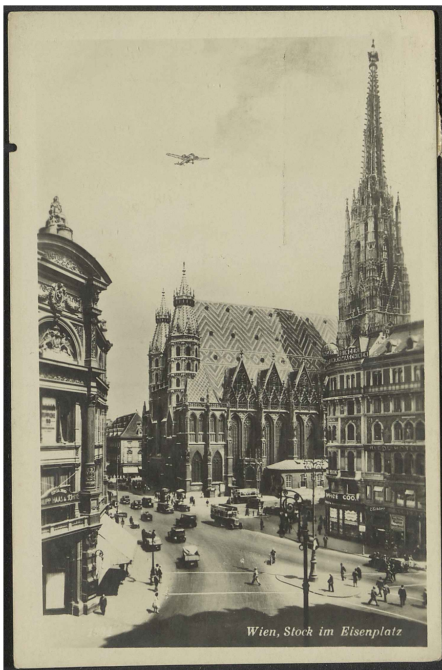
Wien, Stock im Eisenplatz