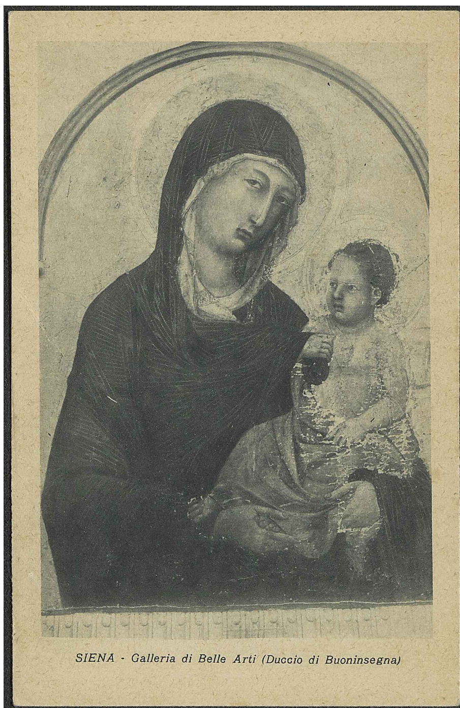
SIENA - Galleria di Belle Arti (Duccio di Buoninsegna)